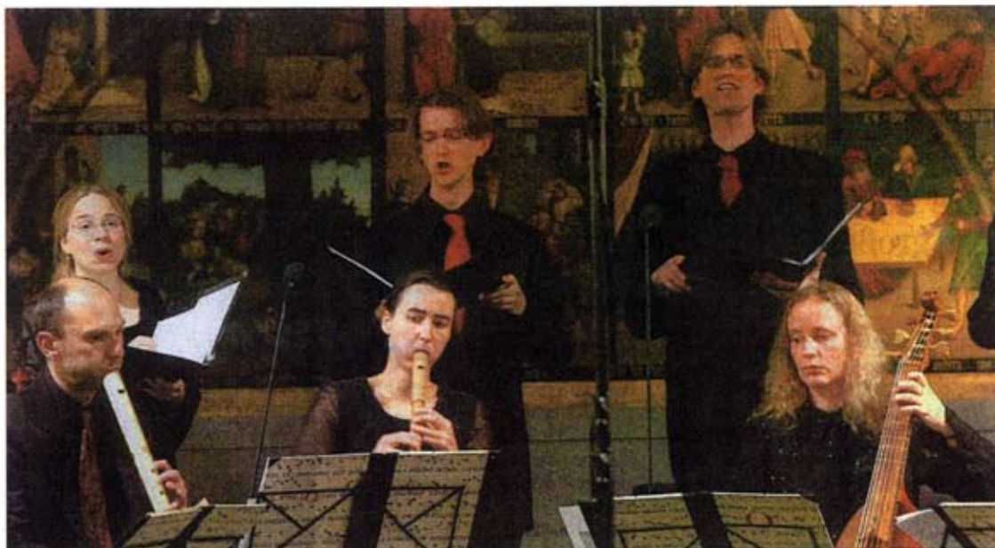
Die Wittenberger Hofkapelle eröffnete im Lutherhaus das dritte Renaissancemusikfestival.